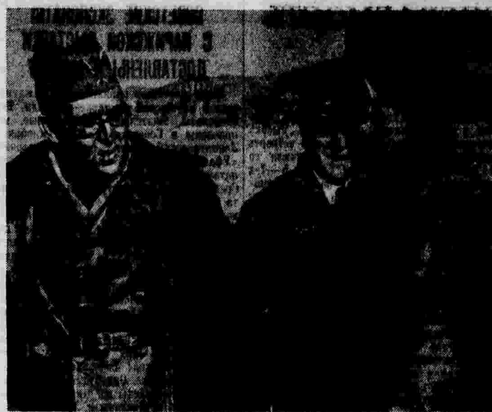
Генерал Висенте Рохо (первый слева) принимает рапорт одного из командиров республиканских войск на участке Теруэла.

ВЕНА, 7 января. (ТАСС). Австрийская печать сообщает, что, наряду с антикоммунистскими мероприятиями по гитлеровскому образцу, румынское правительство проводит также целый ряд реакционных мероприятий, направленных против всех проживающих в Румынии национальных меньшинств. В связи с этим среди венгерского национального меньшинства в Румынии царит паника. Хозяйственная жизнь в населенных центрах районов совершенно парализована. Швейцарская печать сообщает, что преследование новым румынским правительством национальных меньшинств вызывает большое недовольство в кругах Лиги наций. В этих кругах подчеркивается, что мероприятия румынского правительства являются грубым нарушением парижского договора от 9 декабря 1919 года, заключенного между союзниками и объединившимися державами и Румынией. По этому договору Румыния обязалась предоставить всем жителям своей страны полную защиту жизни и свободы, без различия происхождения, национальности, языка, расы и религии, а также право на свободное отправление культа. Базельская «Националь цейтунг» сообщает, что этот вопрос будет, вероятно, поставлен на январской сессии Совета Лиги наций.