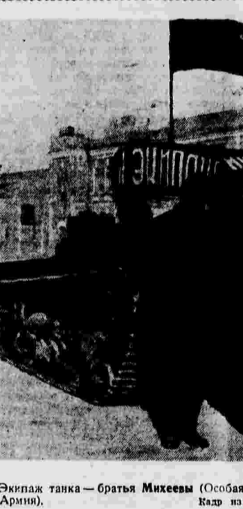
Экипаж танка — братья Михеевы (Особая Краснознаменная Дальне-Восточная Армия).

Недалеко в Иркутске открылись 20-дневные курсы для председателей колхозов. Учится первый набор — 166 человек. До начала весеннего сева на этих курсах будет переподготовлено 500 председателей колхозов.