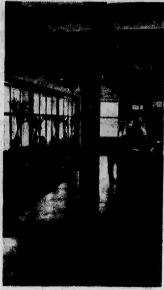
Зал регистрации больных в поликлинике Народного комиссариата путей сообщения на Ново-Басманной улице.