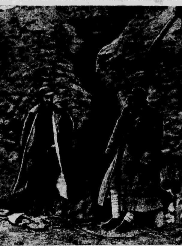
Китайские солдаты возле входа в траншею (на фронте в Северном Китае).

«Япония до сих пор не поняла, — сказал посол, — что китайский народ выступает сейчас единым фронтом и готов перенести любые страдания для того, чтобы сопротивляться японской агрессии до конца».