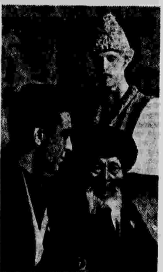
Народный поэт Казахстана орденосец Джамбул и поэт Азербайджана орденосец Самед Вургул Венков на заключительном заседании юбилейного руставелинского пленума правления Союза советских писателей в г. Тбилиси.

* На ряде заводов в прокатных цехах был выделан брак.