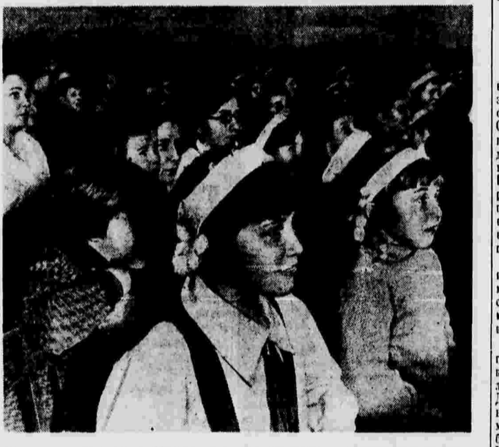
Школьные каникулы в Москве. Дети на спектакле в Московском театре Юного зрителя.

ВОРОНЕЖ, 3 января. (ТАСС). Колхозы Грибановского, Борисоглебского и Песковского районов области занимаются разведением енотов. Создано 13 звероводческих ферм. В этом году они вырастят 185 молодых енотов. В январе колхозы сдадут первые 114 шкурки этого ценного зверя.