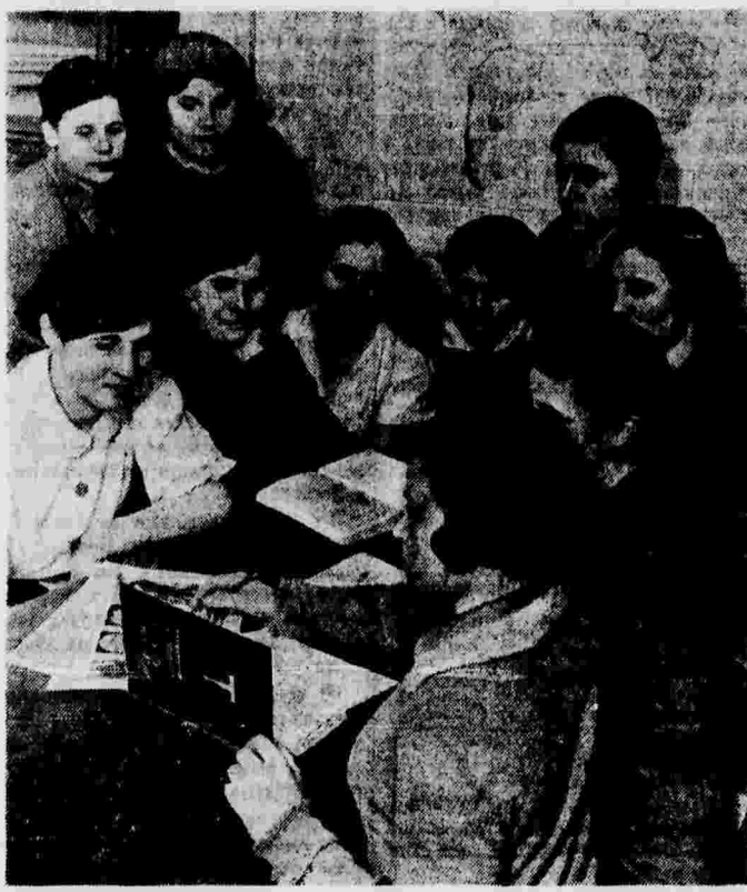
Молодежный политехкружок на шелкопрядильной фабрике «Прометарский труд» (г. Москва). На снимке: урок истории народов СССР.

Вчера состоялось собрание пропагандистов, окончивших курсы. С речью об очередных задачах пропагандистской работы выступил секретарь Московского городского комитета ВКП(б) тов. Братановский. (ТАСС).