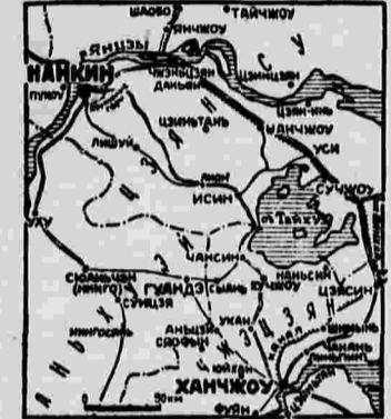
Военные действия в Китае. По всей вероятности, и та и другая сторона не выйдут из города, лежащий в котловине высоких гор вокруг озера, чтобы не попасть в ловушку. Штаб японских войск в Ханчжоу переведен в Сиши (на Шанхай-Ханчжоуской ж. д.).

Продвижение японских войск в сторону Луцжоу (провинция Аньхуэй) и вдоль канала задерживается китайскими войсками. 2 января над Ханьчаном (столица провинции Цзянси) произошел воздушный бой. 23 японских самолета были встречены китайской авиацией. На малонаселенную часть города сброшено свыше 100 бомб. Повреждено девять домов. Во время боя сбиты два японских самолета. Один японский самолет сильно поврежден. В этот же день атакерили китайских самолетов бомбардировала аэродром в Наньшане.