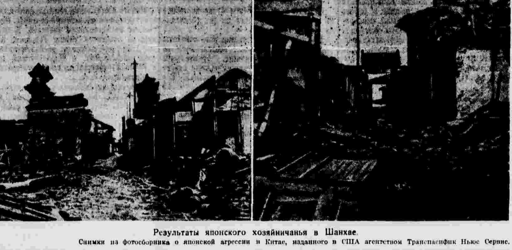
Результаты японского хозяйничанья в Шанхае. Снимки на фотоборнишке о японской агрессии в Китае, изданного в США агентством Транспасифик Ньюс Сервис.