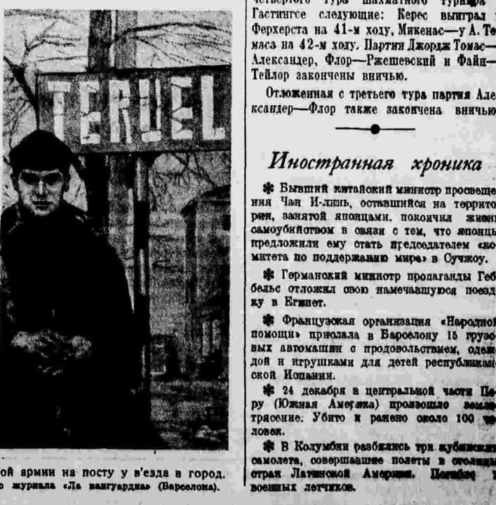
Республиканские войска в Теруэле. Танковая часть на центральной площади города. Справа: боец испанской республиканской армии на посту у вьезда в город. Фото из журнале «Да валгардия» (Барселона).

ЛОНДОН, 31 декабря. (ТАСС). По сообщению агентства Рейтер, результаты четвертого тура шахматного турнира в Гастингсе следующие: Керес выиграл у Ферхерста на 41-м ходу, Микенас—у А. Темаса на 42-м ходу. Партия Джорж Томас—Александр, Флор—Ржевский и Файн—Тейлор закончены ничью. Отложенная с третьего тура партия Александр—Флор также закончена ничью.