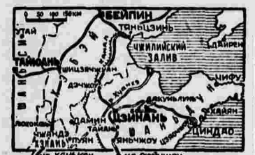
город Тайвань (южнее Цаннаши — столицы провинции Шаньдун). В этом районе происходит сильный артиллерийский бой.

Начиная с 24 декабря, японская авиация ежедневно бомбардирует Тайвань. ТОКИО, 31 декабря. (ТАСС). Как сообщает агентство Доэй Цусима, японские войска заняли Дакуньшунь, к востоку от Цаннаши. Сведений о положении на других фронтах нет.