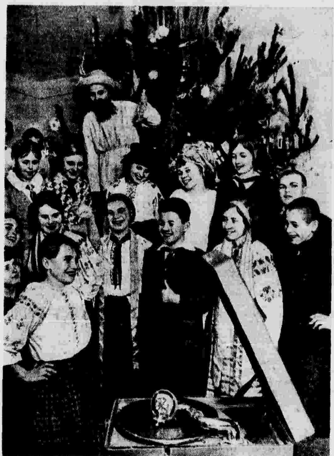
Новогодняя елка для детей колхозников в школе села Мотовиловская Слободка (Фатовский район, Киевской области).