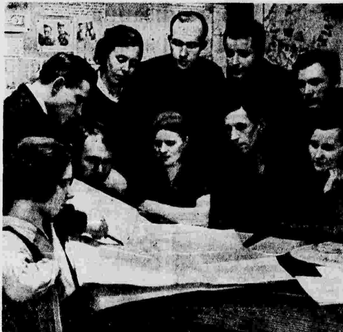
Группа партийных и беспартийных агитаторов фабрики «Красный ткач» (г. Ленинград) на совещании в заводском партийном комитете. На снимке: обсуждение плана прикрепления агитаторов к домам и общежитиям, прилагающим к фабрике.