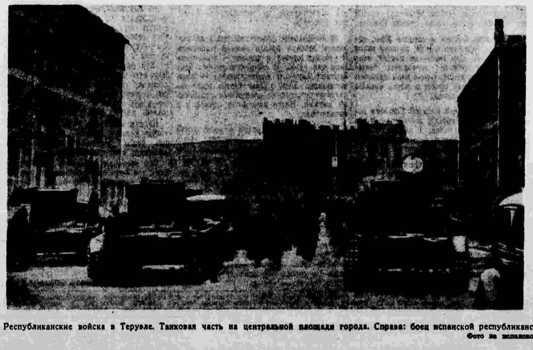
Республиканские войска в Теруэле. Танковая часть на центральной площади города. Справа: боец испанской республиканской армии на посту у вьезда в город.