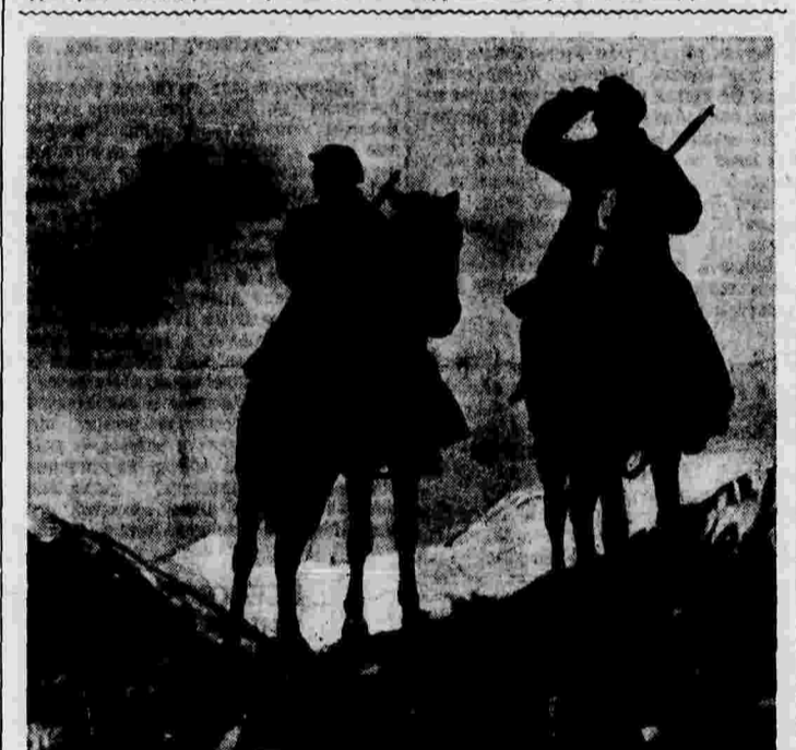
Памир. Бойцы погранзаставы лейтенанта Телесова обьезжают границу.

езда с германскими военными грузами. Из Италии эти грузы направляются испанским итехникам. Газета подчеркивает, что эти действия нарушают нейтралитет Швейцарии.