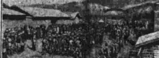
Английский военный лагерь (шотландцы на страже) на индо-афганской границе.

19-го декабря с утра появились английские самолеты, которые сбрасывали бомбы на повстанцев в районе Кутанга. Было похищено несколько повстанцев из Кабула. Батарея выехала в город из района Кутанга.