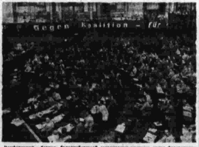
Конференция в Берлине. Германская делегация экономического сотрудничества с СССР.

Двойная вина. На московском заседании ЦК ВКП(б) 24 ноября пленум ЦК ВКП(б) принял решение о введении в действие постановления ЦК ВКП(б) «О мерах по укреплению дисциплины и порядка в рядах партии и правительства». Двойная вина. На московском заседании ЦК ВКП(б) 24 ноября пленум ЦК ВКП(б) принял решение о введении в действие постановления ЦК ВКП(б) «О мерах по укреплению дисциплины и порядка в рядах партии и правительства». Двойная вина. На московском заседании ЦК ВКП(б) 24 ноября пленум ЦК ВКП(б) принял решение о введении в действие постановления ЦК ВКП(б) «О мерах по укреплению дисциплины и порядка в рядах партии и правительства».