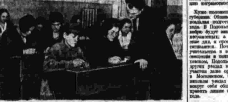
Занятия с неграмотными в 8-й школе Бульварного района (Москва).

Наша школа I ступени на 30 проц. является подростками в возрасте 12-16 лет. В ряде случаев работа по ликвидации неграмотности ведется в недостаточной мере. В ряде случаев работа по ликвидации неграмотности ведется в недостаточной мере. В ряде случаев работа по ликвидации неграмотности ведется в недостаточной мере. В ряде случаев работа по ликвидации неграмотности ведется в недостаточной мере.