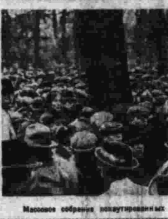
Массовое собрание заводчан в Днепропетровске.