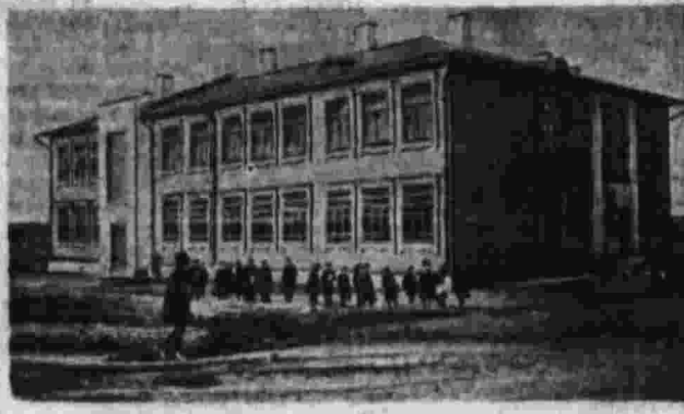
Новая школа в Кольчугине.

Вчера год завод по производству... 25 предприятий с 124.700 рабочими переведены на 7-часовой рабочий день. — 35 проц. крестьянских хозяйств освобождено от сельхозналога. — На рабочем жилищном строительстве дополнительно ассигновано 50 млн. рублей. — Построено 300 новых школ в деревнях и фабрично-заводских поселках. — Деревянная беднота освобождена от платы за землеустройство. — Улучшены ассигнования на обеспечение инвалидов войны. — На утверждение очередного Съезда Советов вносится проект закона об обеспечении за счет государства престарелых маломощных крестьян.