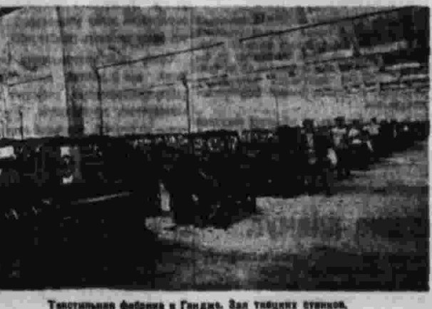
Трудовая американка в Ганди. За ней тысячи станин.