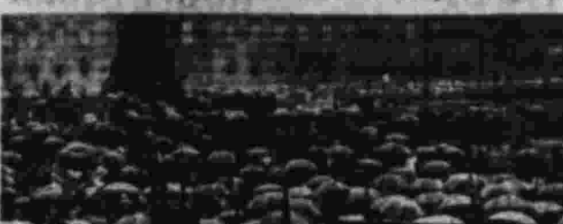
Митинг организованной молодежи в Липпестрате (Берлин). Митинг по поводу 50-летия со дня издания закона против социалистов.