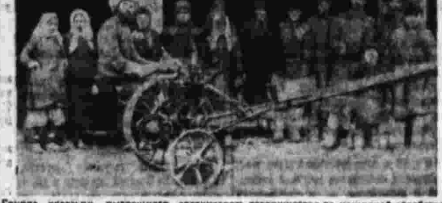
Группа крестьян, пытающаяся организовать товарищество по машинной обработке земли.

Вопрос о развитии народного хозяйства и дорожном хозяйстве неразрывно связаны. Развитие народного хозяйства, рост товарности и острота материальных потребностей требуют соответствующего развития дорожной сети. Необходимо приложить к этому делу все силы и средства. Дорожное хозяйство — это основа экономического развития страны. Без дорог немыслима ни торговля, ни промышленность, ни сельское хозяйство. Дороги — это артерии народного хозяйства. Без них страна обречена на отсталость и бедность.