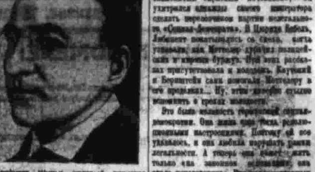
Репетиция. Шумовый аппарат...

Вопрос о переизбрании депутатов в Советы (продолжение).