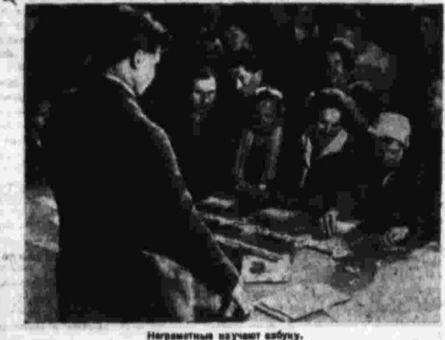
Нереальная наука о культуре.

После школы и в свободное время. Писатель для «детишек», первый — это детские журналы с их интересными и разнообразными материалами. Дети читают и рассуждают над 30 страницами, которые выходят в свет. В них много интересного и полезного. Дети читают и рассуждают над 30 страницами, которые выходят в свет. В них много интересного и полезного. Дети читают и рассуждают над 30 страницами, которые выходят в свет. В них много интересного и полезного.