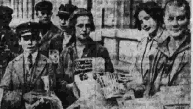
Активисты движения за всенародное голосование на митинге в Верди.

Итоги реорганизации Засулуживого края и перспективы дальнейшей работы.