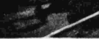
Ленинградцы — победителями во владении мяча.

РКК обследует порядок приема посетителей в советских учреждениях. РКК обследует порядок приема посетителей в советских учреждениях.