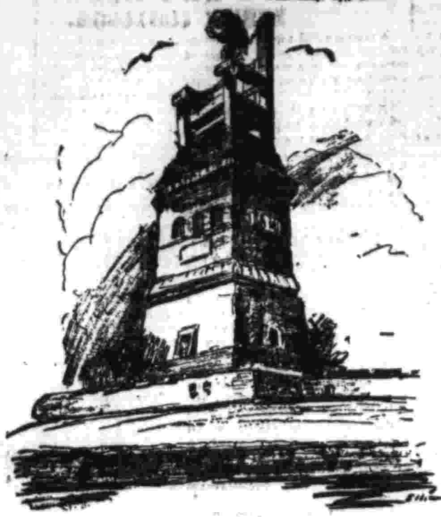
Символ буржуазной истинности.