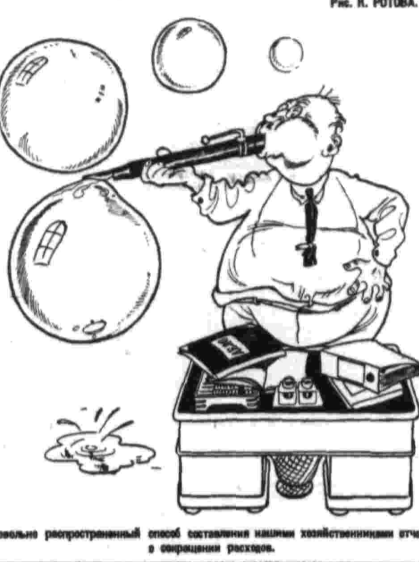
Древний распространяемый способ составления мнимых хозяйственных отчетов о сокращении расходов.

В ряде крупных административно-управленческих расходов выявлены случаи перерасхода. Коэффициент экономии выходящих из бюджета сумм, представляющих отчет о выполнении работы, в ряде случаев не достигал нормы. Это указывает на то, что экономия не достигла нормы. Это указывает на то, что экономия не достигла нормы.