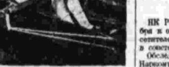
Ленинградцы — победителями во владении мяча.