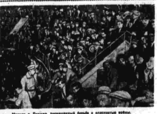
Митинг в Париже, посвященный борьбе с опасностью войны.