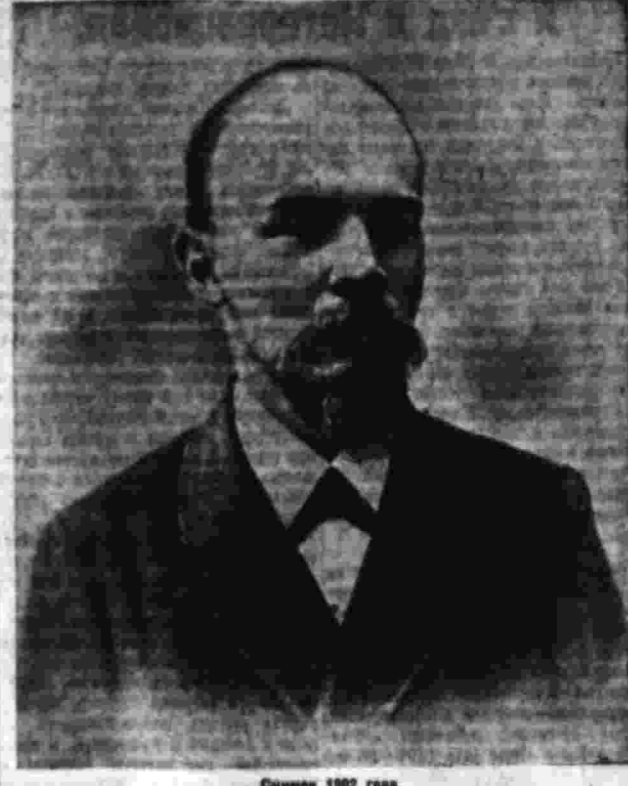
Снимок 1902 года.