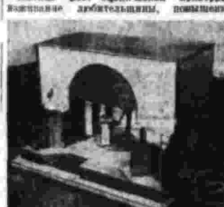
Может показаться, что в любительской работе нет ничего интересного...