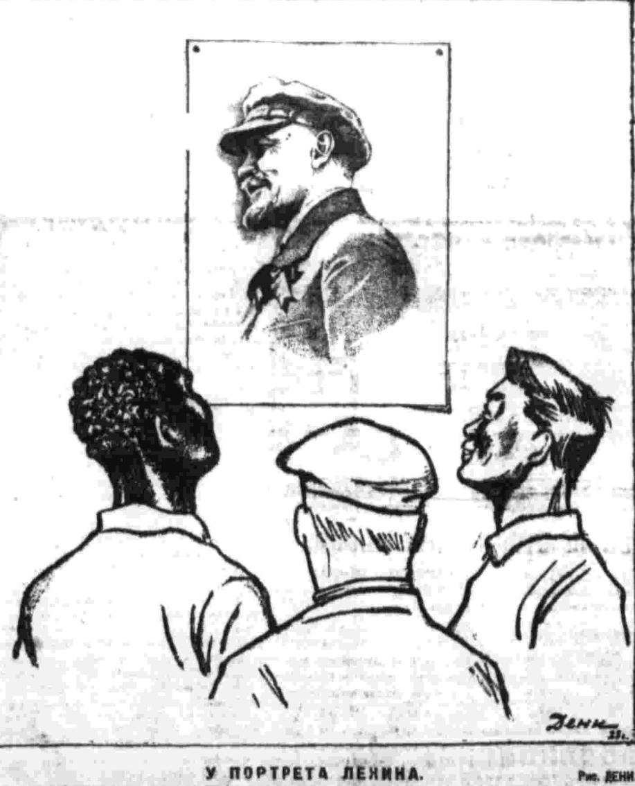
У ПОРТРЕТА ЛЕНИНА.

Вопрос о молодежи и ее роли в мировом коммунистическом движении представляет собой действительно глобальную проблему. Вопрос не в том, чтобы в отношении молодежи в настоящее время не было никаких ограничений, а в том, чтобы в отношении молодежи в настоящее время не было никаких ограничений. Мы должны в этот период сделать все возможное для того, чтобы эта молодежь, которая составляет основную массу молодежи в настоящее время, выросла во время войны. Центр вопроса в том, в каких условиях росла эта молодежь и в какие сроки она получила политическое образование.