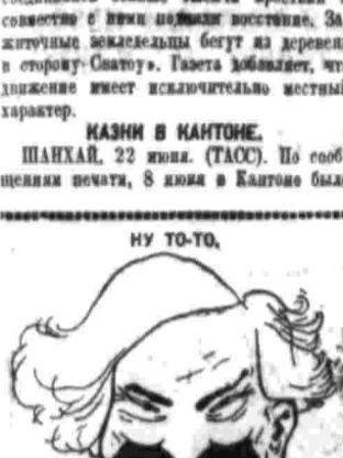
Рабочая партия немаловажно отличается от либеральной и социал-демократической...