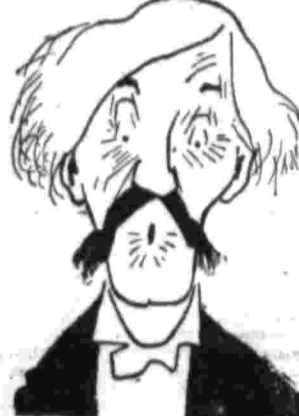
Рабочая партия немаловажно отличается от либеральной и социал-демократической...