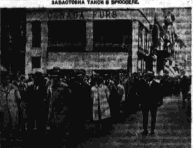
Забастовка такон в Бросселе.