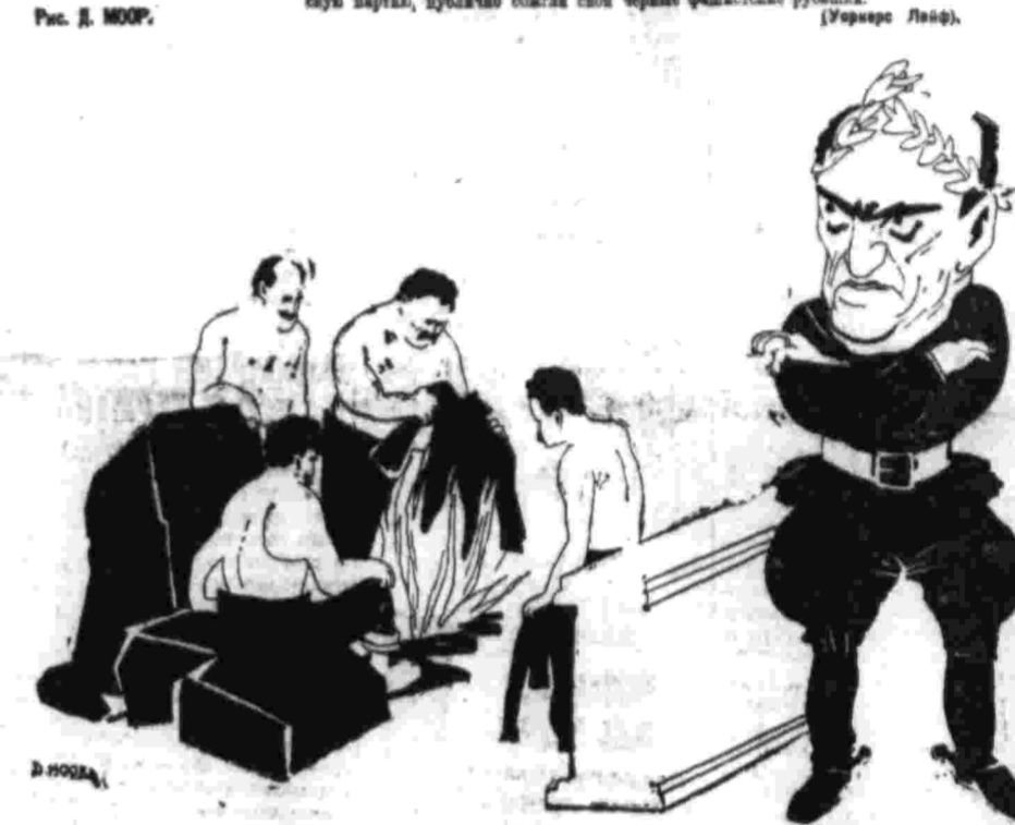
Сегодня они игут фашистские рубашки... А завтра?