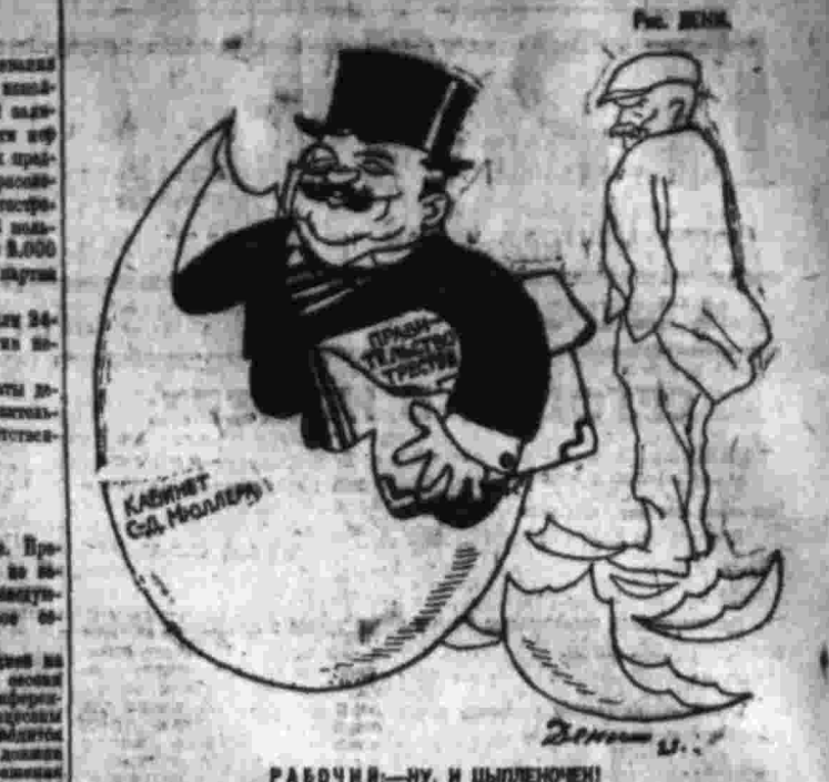
РАБОЧИИ—НУ, И ЦЫПЛЕНОЧКИ!