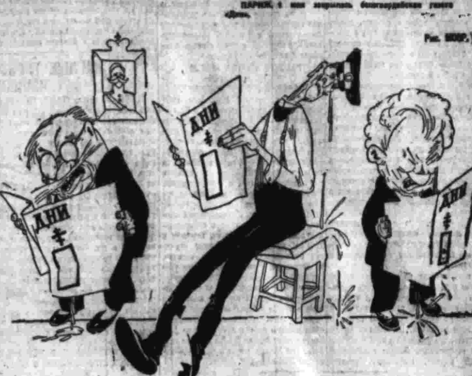
Последний номерный «Денечка» читаю с вами я, друзья...

«СЕМ ПРОСТИТУТОК», «ГЛУПАЯ И ЧУДОВИЩНАЯ КОНСТИТУЦИЯ», «БУДУЩИ ДИКТАТОРЫ ПОЛЬШИ», «ИМЕЛ ВОЗМОЖНОСТЬ РАЗДАВИТЬ СЕМ, КАК ЧЕРВЯКА». ВАРШАВА, 3 июля. (ТАСС). В последние дни в Варшаве появились слухи о том, что Пилсудский собирается изменить конституцию Польши. Эти слухи вызвали большое возмущение среди польских коммунистов. Они считают, что Пилсудский хочет вернуть себе диктаторские полномочия. В ответ на эти слухи коммунисты выпустили листовку, в которой говорится: «Пилсудский угрожает сему. Сем — это пролетариат, это основа нашей революции. Пилсудский хочет раздавить сем, как червяка. Мы будем бороться с ним до конца».