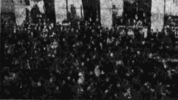
Общий вид зала суда.