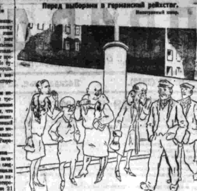
Бесплатная пропаганда буржуазных партий и выборов.