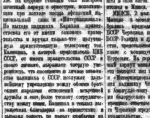
Встреча на вокзале.