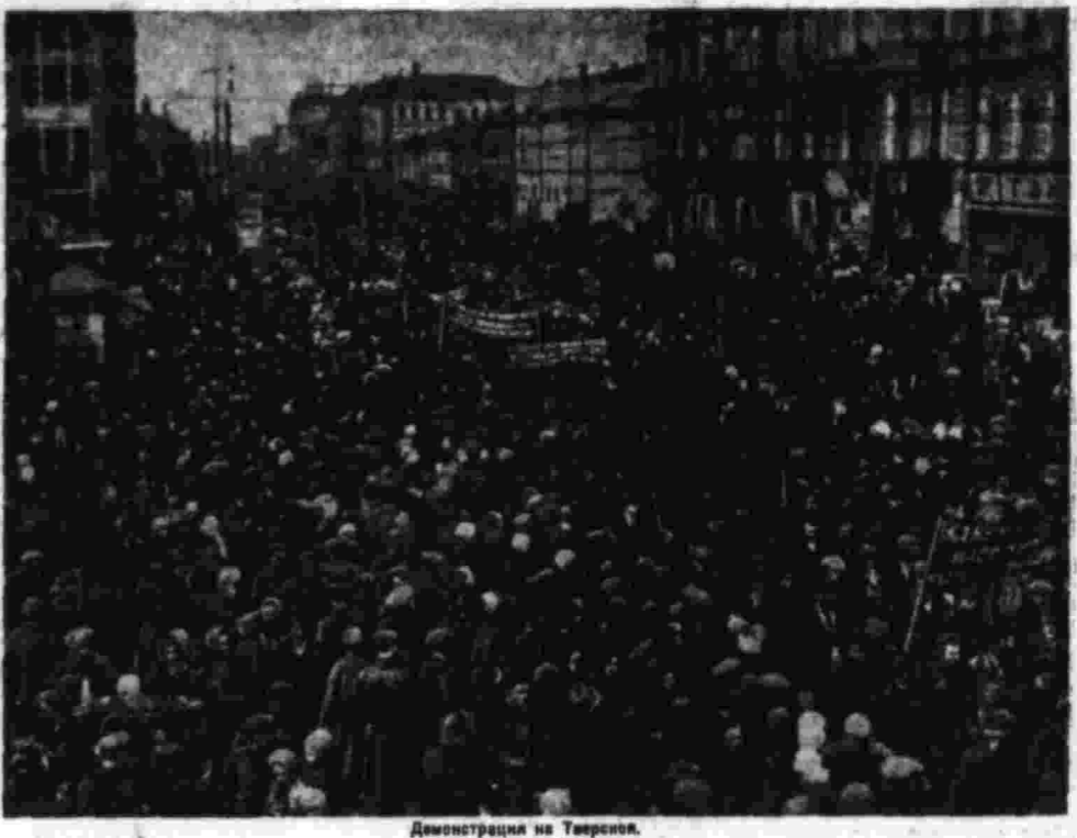
Демонстрация на Тверской.

Каждый год в этот исторический день мы проводим торжественные собрания в ознаменование победы в Великой Отечественной войне.