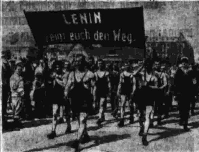
Демонстрация в Берлине в день 1 мая.