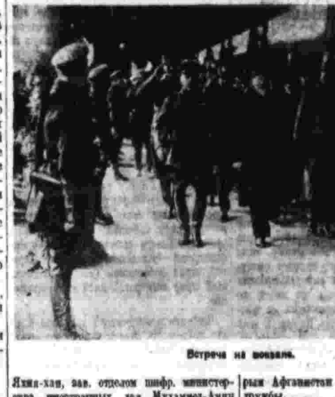
Встреча на вокзале.