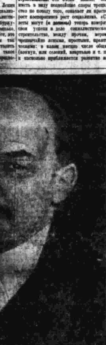
НЕОПУБЛИКОВАННЫЙ СНИМОК В. И. ЛЕНИНА.