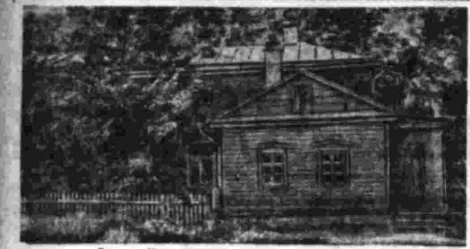
Дом в Ульяновке, в котором жил В. И. Ленин.