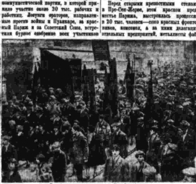
Демонстрация 19 апреля в Пре-Сен-Мерсе.

ПРОТИВ ПУАНКАРЕ, ЭРРИО, БЛОМА, ЗА СОВЕТСКИМ СОЮЗОМ.