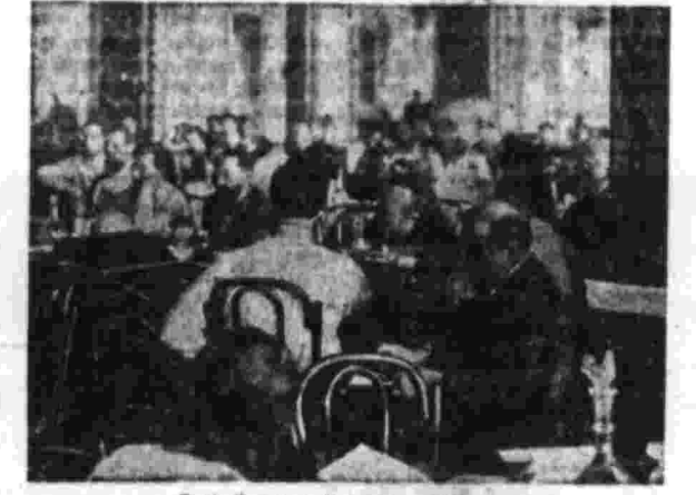
В. И. Ленин на II конгрессе Коминтерна.