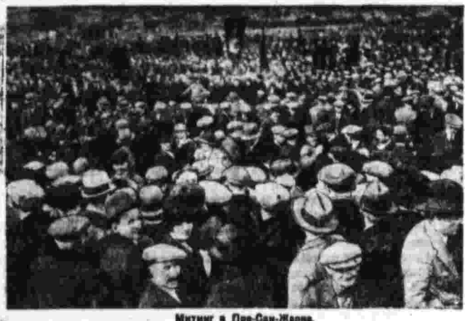
Митинг в Пре-Сен-Мерсе.

В связи с предстоящими выборами в Париже состоялась массовая демонстрация коммунистической партии, в которой приняло участие около 20 тыс. рабочих и рабочих.