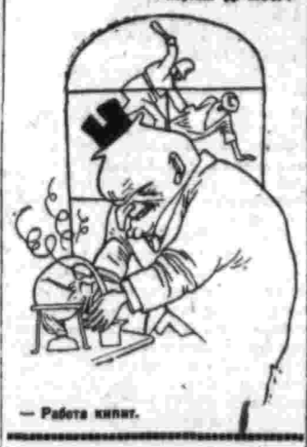
— Работа книги.

Ваше исследование о работе политехнической комиссии по работе ученых, выходящей из своей лаборатории. (Литовская, Москва).