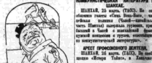
— Реакция, которую и сейчас поддерживают, должна быть повторена полностью.