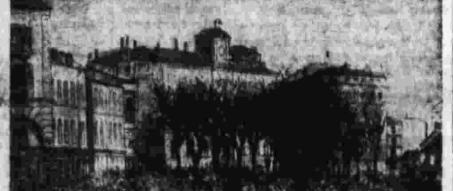
Политическая национализация гвардии 18 марта 1871 г.