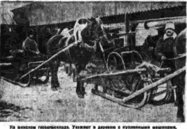
На вилках госхоза. Уезжают в деревню на купленных машинах.

НОВОСИБИРСК, 16 марта. (Наш корр.) Основана на своевременное снабжение деревни современным сельскохозяйственным инвентарем — одно из главнейших условий успеха весенней посевной. В Новосибирске, 16 марта. (Наш корр.) Основана на своевременное снабжение деревни современным сельскохозяйственным инвентарем — одно из главнейших условий успеха весенней посевной.