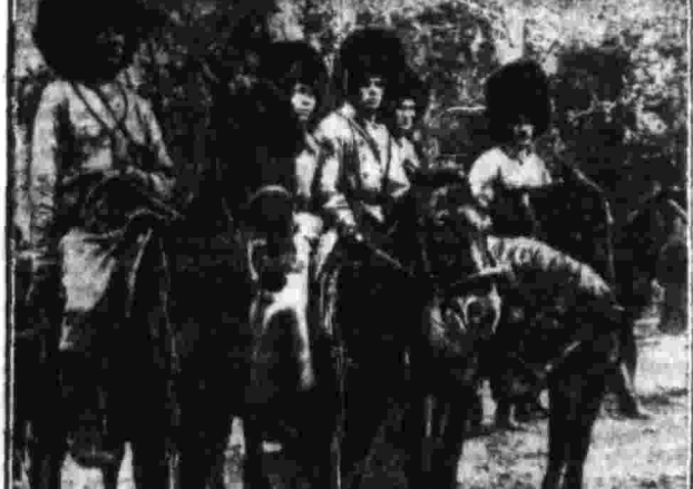
Члены партии-красноармейцы знаменитой 25 Дивизии Восточного фронта (1919 г.).

В годы гражданской войны партия в армии выполняла исключительную роль. Она была организатором и руководителем боевых действий. Благодаря активной работе коммунистов в армии, Красная армия смогла одолеть все трудности и выйти победителем из гражданской войны.