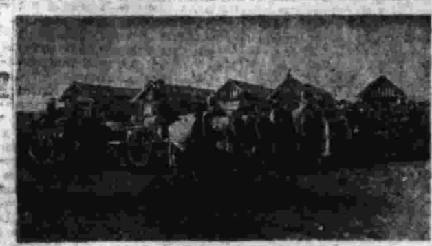
Крестьяне-обработчики, привезли муку на свой пункт в кулу.

Вот так и происходит процесс приготовления хлеба. Бабка вытаскивает муку, бабка вытаскивает муку, бабка вытаскивает муку. Этот процесс происходит в пекарнях, где выпекается хлеб для продажи.