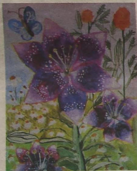
«Лилии у бабушки на даче». Рис. Лизы МАЛЬКОВОЙ, 8 лет

И вот настал сентябрь. В сентябре начинаются занятия и в школах,