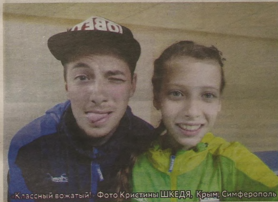
«Классный вожатый!» Крым, Симферополь

Хороший вожатый для детей — это старший друг и товарищ. От него можно ничего не скрывать, с ним можно обсудить абсолютно всё без стеснения и тревоги. Чтобы быть вожатым, нужно любить детей. Ни от кого не получишь столько позитивной энергии, любви и отдачи, как от ребёнка. У вожатого, как в любой другой профессии, есть сложности. Нелегко бывает найти подход к каждому ребёнку. На время лагерной смены все дети и вожатые — это одна большая семья.