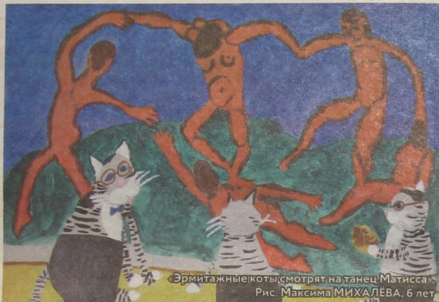
«Эрмитажные коты смотрят на танец Матисса». Рис. Максима МИХАЛЁВА, 6 лет

и в клубах. Одной ехать было страшновато. Я уговорила подругу Ленку. Мы надели резиновые сапоги, потому что шёл проливной дождь, а у нас, на окраине, это было настоящим половодьем. Мы сели на трамвай и доехали до Невского проспекта. Дошлёпали до Фонтанки. Нашли редакцию. Поискали — опоздали. Входим, а все уже сочиняют. Аккуратные такие. А мы запыхавшиеся, в грязных резиновых сапогах. От волнения начали безостановочно смеяться, застыв в дверях. На нервной почве это бывает.