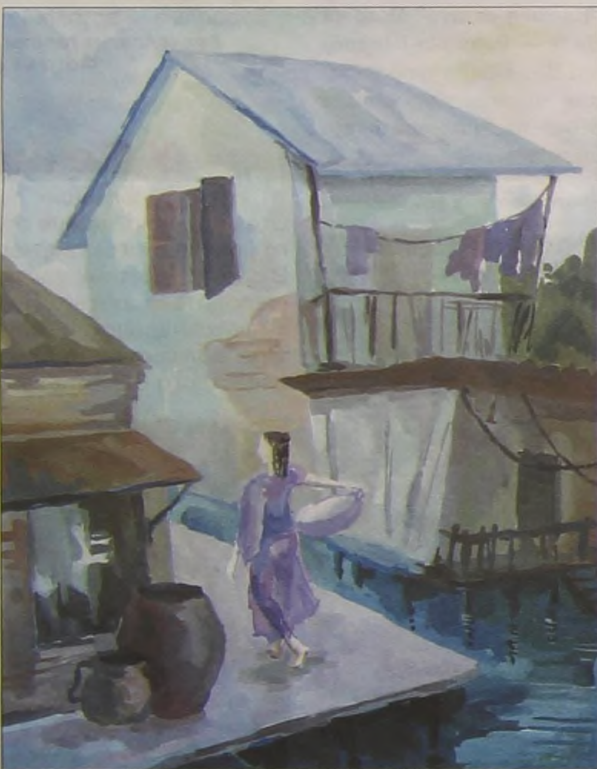
"Дух времени". Рис. Наташи Талашмановой, Екатеринбург.