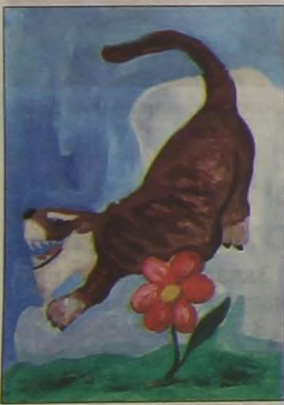
"Счастливы тигр". Рис. Гранта Давтяна, Москва.

Татьяна КУДРЯВЦЕВА, редактор. Санкт-Петербург.