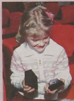
Как приятно получить приз за актёрское мастерство!

Все школьные театры отмечены. Лучшие получили премии лауреатов. Были и специальные номинации. Приз зрительского жюри — в него входили сверстники юных актёров — получила театральная студия