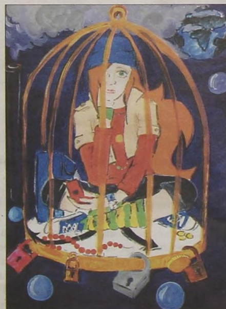
"Золотая клетка". Рис. Даши Бондарь, г. Донецк.

Наши индексы: в каталоге агентства "роспечать" — 50101; в каталоге российской прессы "Почта России" — 61900, для годовой подписки — 12283; в каталоге "Пресса России" — 40501.