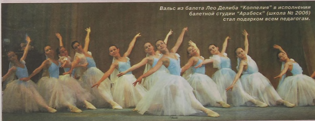
Вальс из балета Лео Делиба «Коппелия» в исполнении балетной студии «Арабеск» (школа № 2006) стал подарком всем педагогам.