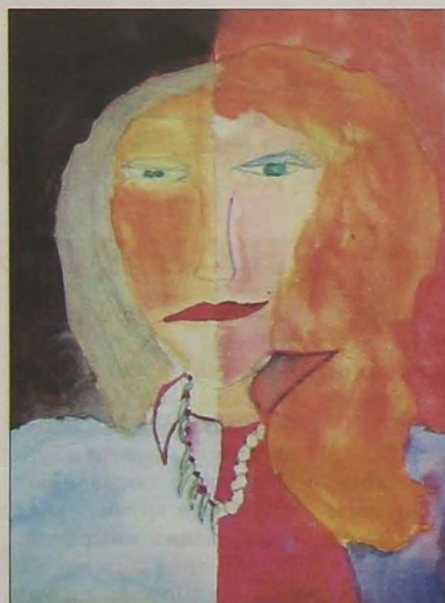
"Время не остановить". Рис. Ульяны Гарбуз, г. Минск.