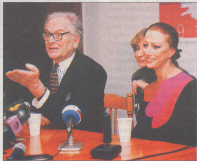
Е. МИХАЙЛОВА.

цах веточек-проводков, что в руках у актрисы, рисуют в темноте замысловатые линии. Может, и правда, такое через несколько лет "будет носить-ся"?