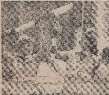
Настроение юных инспекторов движения соответствует автотренировке в Горьком. И то и другое — неплохо. Но очень хочется, чтобы было ещё лучше. Фото: Сергей Марков, Елена Вржинева и их друзья. Фотохроника ТАСС.