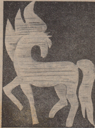
СТРАНИЧКИ «ДОМАШНЕЕ ЭНЦИКЛОПЕДИИ» подготовила Е. Михайлова.

На килограмм очищенных яблок — 1 стакан сахарного песка.