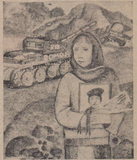
Рисунок Ярослава Белинского «Где же ты, мой сыночек!».