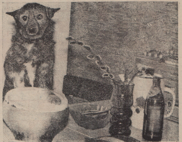
ЧТО СЕГОДНЯ НА ОБЕД?

Света ТЕТЕРИНА. Ярославская область, г. Тутаев.