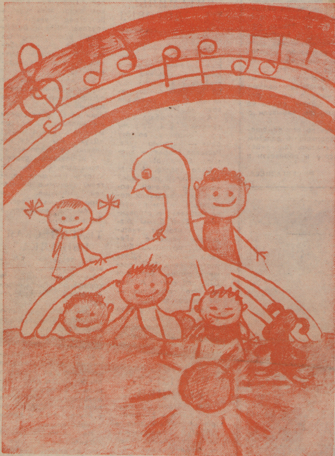
«ГОЛУБЬ МИРА — ГОЛУБЬ ДЕТСТВА».

Четверг, 4 июля 1991 г. Газета основана 6 марта 1925 года Выходит по вторникам, четвергам и субботам. Цена 3 коп.