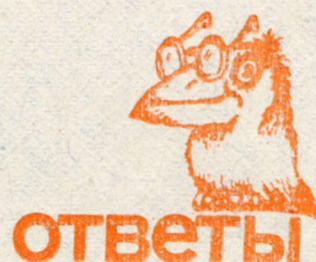
Рис. Н. ШМИДТ.

(Смотрите «Пионерскую правду» №№ 81—85).