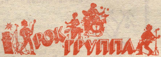
Рис. Н. ШМИДТ.