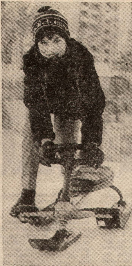
Зима в Калининграде.