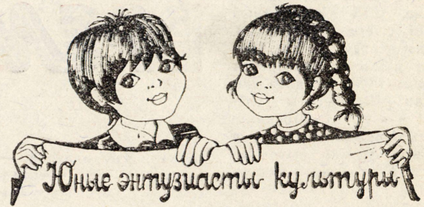
Рис. А. ВЕРНИГОРЫ.