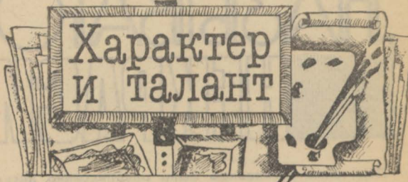
Рис. А. СЕМЕНОВА.

Как аппетитно выглядит румяный колобок на одной из иллюстраций к русским народным сказкам художницы Л. Михайловой! А на акварели А. Кудрявцева, словно живой, пытит самовар, начищенный до такого блеска, что в нём видно лицо хозяина, любителя почаёвничать.