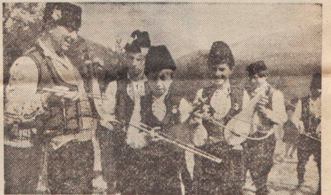
НА СНИМКАХ: ● На одной из площадей болгарской столицы. ● Зажигательную народную мелодию исполняют юные болгарские музыканты.

9 сентября 1944 года в Болгарии свершилась социалистическая революция. В бой за новую жизнь вели народ болгарские коммунисты. Днём Свободы назвали этот день наши болгарские братья. Народная власть сразу же начала строить новое справедливое общество. Из отсталой страны Болгария превратилась в развитое социалистическое государство. Свою цель братский народ видит в том, чтобы превратить страну в высокоразвитое социалистическое государство. Так решил народ и коммунисты Болгарии на XIII съезде своей партии. И в эту работу сейчас включается каждый болгарский коммунист, каждый гражданин республики. Торжественно собирается отметить болгарский народ свой национальный праздник. Как всегда, в городах и сёлах страны пройдут народные гулянья с весёлыми песнями и плясками. А в ночь на 9 сентября на шпиле здания Центрального Комитета Болгарской коммунистической партии зажжётся огромная рубиновая пятиконечная звезда. Такая же, как над башнями Московского Кремля.