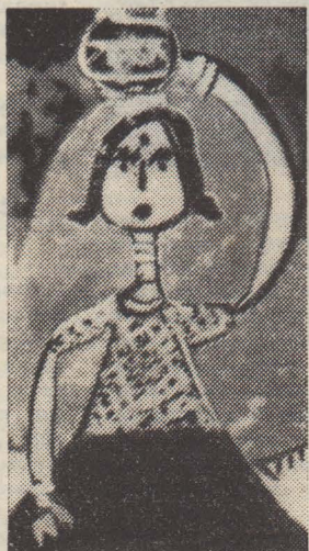
ЭТО Я. К. Джети, 6 лет.

Нас посадили на почётные места в первом ряду, и праздник начался. На школьных индийских праздниках ребята много поют и танцуют. Ребята начали свой концерт с песен и танцев разных штатов Индии. В Индии много разных народностей, и у каждой свои песни, танцы, кос-