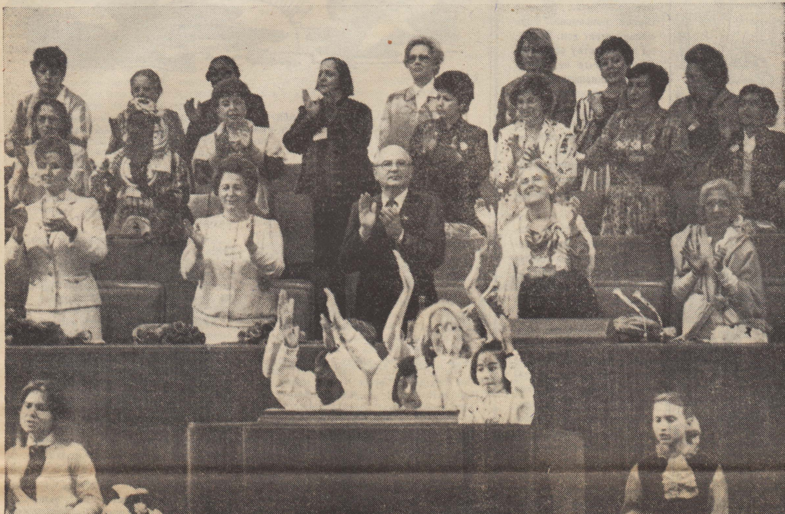
Москва. 23 июня в Кремлёвском Дворце съездов открылся Всемирный конгресс женщин под лозунгом «К 2000 году — без ядерного оружия! За мир, равенство, развитие!». На снимке: дети приветствуют участников конгресса.

К БОРЬБЕ ЗА ДЕЛО КОММУНИСТИЧЕСКОЙ ПАРТИИ СОВЕТСКОГО СОЮЗА БУДЬ ГОТОВ!