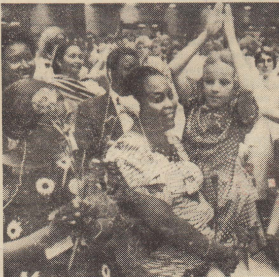
В перерывах между заседаниями.