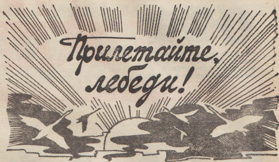
Рис. О. КОРНЕВА.

Хабаровский край, г. Комсомольск-на-Амуре.