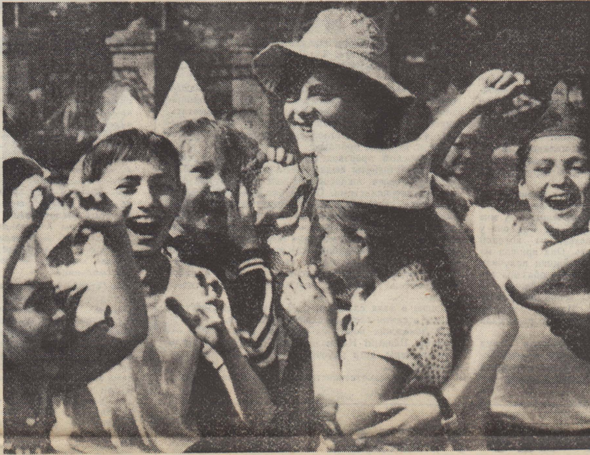
Московская область, г. Железнодорожный.