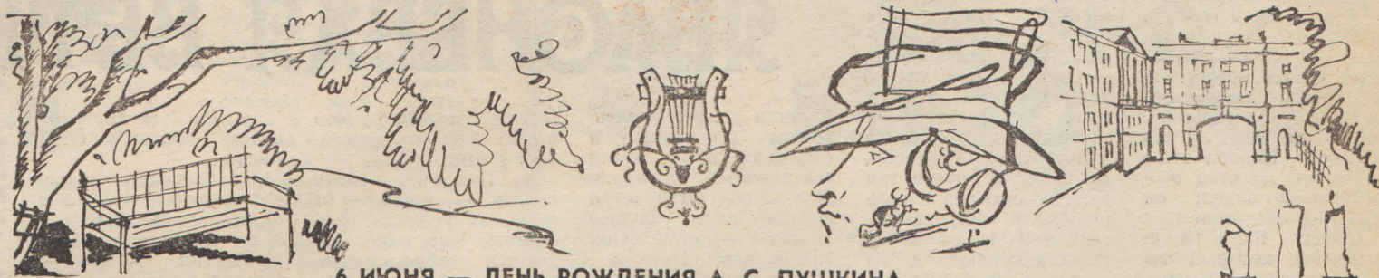
6 ИЮНЯ — ДЕНЬ РОЖДЕНИЯ А. С. ПУШКИНА.