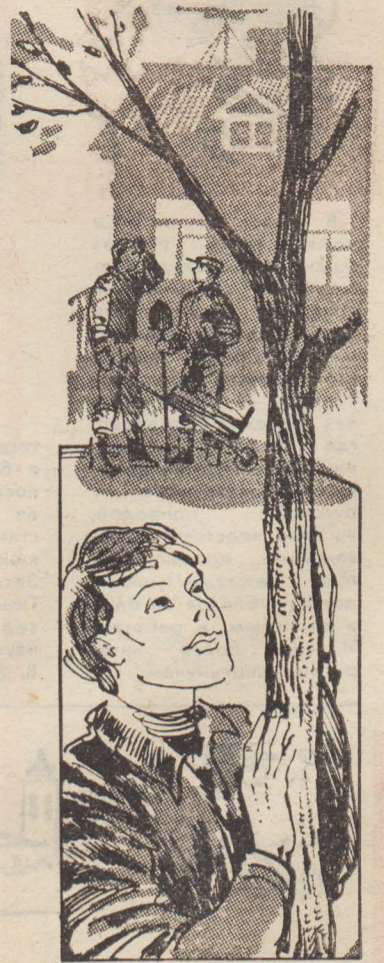
Рис. А. ЛЕБЕДЕВА.

И я подумал, что больше ни о чём ребят спрашивать не надо.