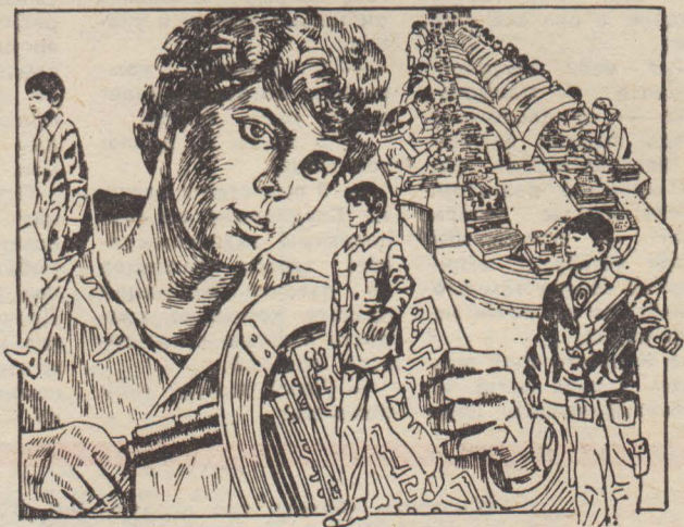
Рис. О. КОПНЕВА.