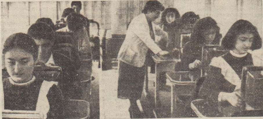
НА СНИМКЕ: у дисплеев — ученики школы № 118 г. Еревана Скоро прозвенит звонок, и «Компьютер» отправится дальше — и другим ребятам. В Армении такие автобусы приезжают и в городские, и в сельские школы.