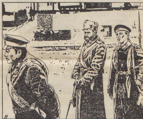
Рис. Л. РЯБИННИНА.